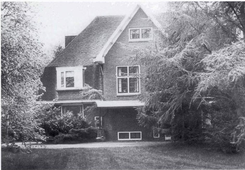
Villa Haimers Esch aan de Gerinkshoekweg (vroeger Strootsweg), gebouwd door en voor Arend Beltman in 1924, van 1938 tot eind 1942 in gebruik bij de Palestina-pioniers

konden zijn; daardoor verloren o.a. de Palestijnen hun nationaliteit en werden stateloos.