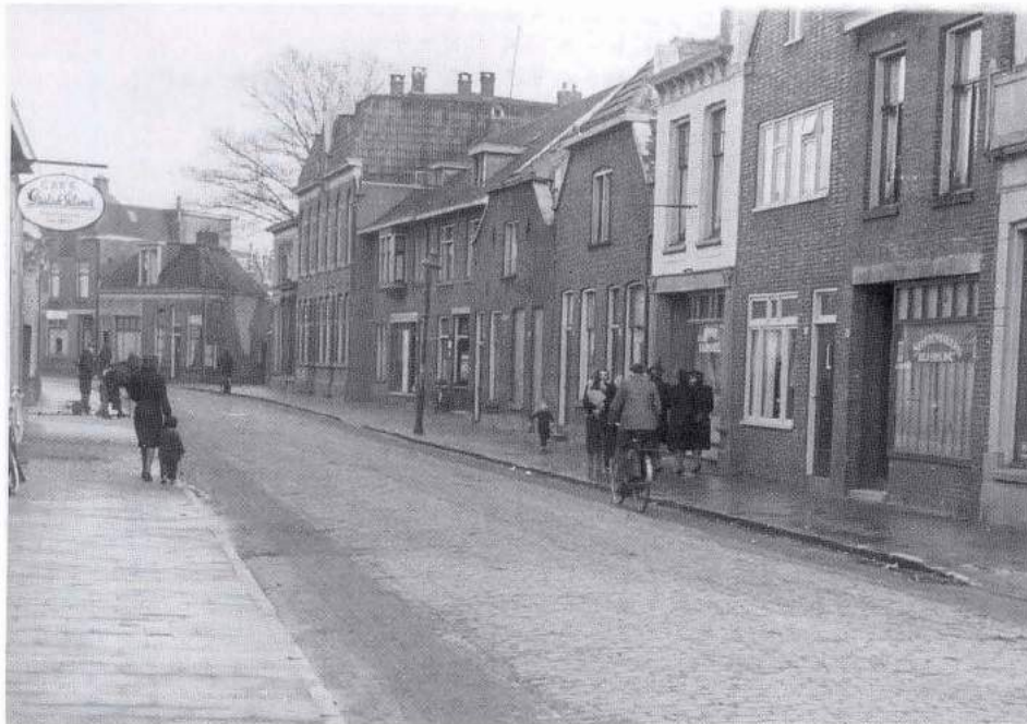
De Alsteedschestraat, ter hoogte van de Mooienhofstraat, in 1940 (situatie thans onherkenbaar: Kuipersdijk!)