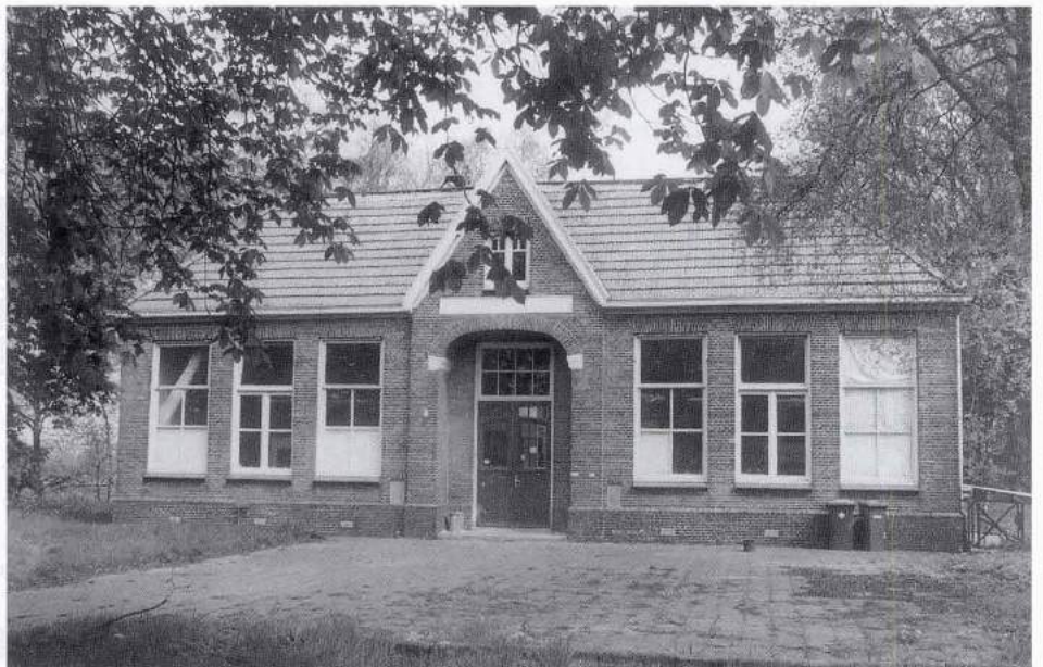
Het Twekkeler schooltje, waar de mammen van de Hachsjarah sliepen, werd door de gemeente Enschede beschikbaar gesteld op verzoek van het Comité Duitse Vluchtelingen

De contacten tussen de joden in de stad en die in Twekkelo werden